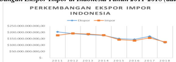
Gambar 1. Perkembangan Ekspor-Import di Indonesia Tahun 2011-2018 (dalam US $)

Sumber: Badan Pusat Statistik (BPS) tahun 2011 – 2018