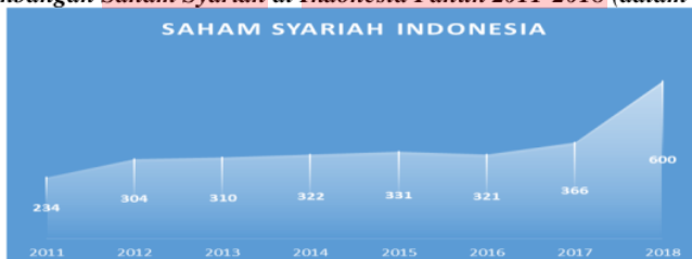
Gambar 2. Perkembangan Saham Syariah di Indonesia Tahun 2011-2018 (dalam Triliun)