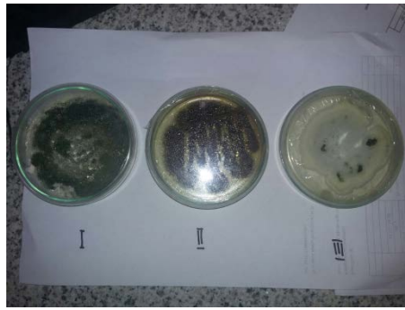
Gambar 1. Isolat (I = J1, II=J2, III=J3)

yang mempunyai karakter: koloni berwarna kuning kecoklatan hingga coklat kehitaman, sedangkan secara mikroskopik mempunyai hifa baik bersekat maupun tidak bersekat, konidiofor tidak bercabang yang mempunyai sterigma primer dan sekunder.