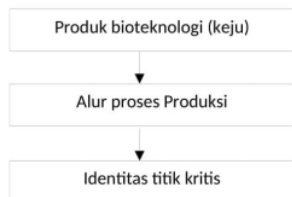
Gambar 1. diagram alir dan proses produksi serta penentuan titik kritis keju

Duncan's Multiple Range Test (DMRT) pada taraf signifikansi 5% untuk mengetahui beda nyata antar perlakuan. Penelitian ini dilakukan dengan 3 (tiga) tahap yaitu pembuatan produk pangan (keju), pembuatan alur/diagram alir proses produksi dan identifikasi resiko titik kritis produk.