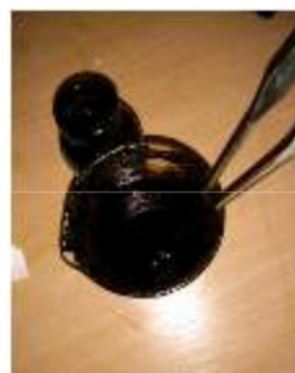
Gambar 1. Hasil ekstrak pekat

Serbuk daun kitolod merupakan bahan yang digunakan sebagai sampel dan diekstraksi untuk mendapatkan pemisahan senyawa yang diinginkan. Ekstrak kental yang didapatkan setelah dikentalkan dan dipekatkan dapat dilihat di bawah ini.