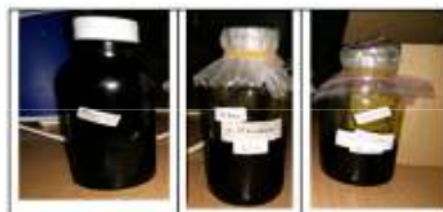
Gambar 2. Ekstrak hasil fraksinasi

Ekstrak kental yang diperoleh kemudian difraksinasi untuk mendapatkan fraksi sesuai dengan tingkat kepolarannya. Berikut hasil fraksi.