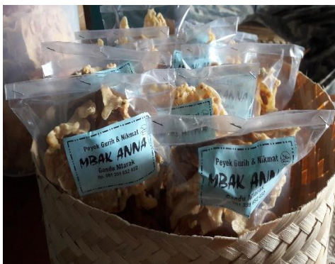
Gambar 2. Produk Mitra IKM dengan pengemasan sederhana dan menggunakan alat steples untuk menutup kemasan.

Selanjutnya adalah memberikan pelatihan kepada mitra IKM tentang cara dalam melakukan branding yaitu dengan mengubah merek yang terpasang pada label yang masih sederhana menjadi merek yang menarik. Hal ini dilakukan dengan cara membuat merek peyek mbk Anna dengan membuat desain label produk peyek yang bagus dan berdaya jual seperti gambar 4.