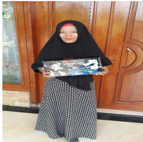
Gambar 3. Kegiatan pengabdian masyarakat dengan memberikan alat sealer untuk meningkatkan pengemasan yang rapi dan baik.