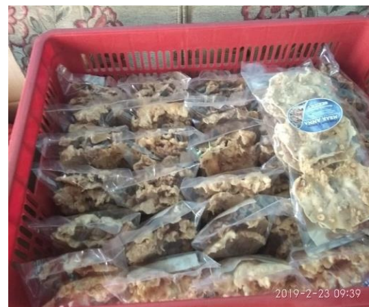
Gambar 10. Peningkatan pesanan produk mitra IKM setelah adanya pengabdian masyarakat