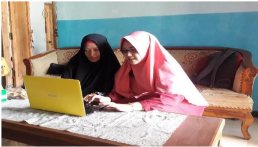
Gambar 4. Pelatihan dalam membentuk branding melalui desain merek dan label yang menarik.

Berikutnya adalah mencetak hasil dari desain branding menjadi label yang bagus untuk dapat ditempelkan pada produk peyek mbk Anna seperti gambar 5.