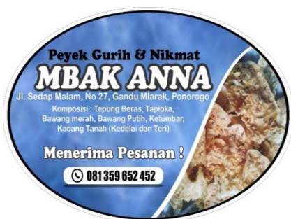
Gambar 6. Label baru Peyek Mbak Anna

Berikutnya yang dilakukan adalah memberikan pelatihan kepada mitra IKM untuk membuat promosi melalui media online yaitu membuat blog. Hal ini bertujuan salah satunya untuk menginformasikan kepada masyarakat luas tentang produk peyek mbak Anna, selain itu juga untuk memperluas pangsa pasar produk tersebut. Blog dibuat dengan tampilan yang menarik dan dapat tersambung untuk di share ke media massa lain seperti facebook, instgram dan juga whatsapp.