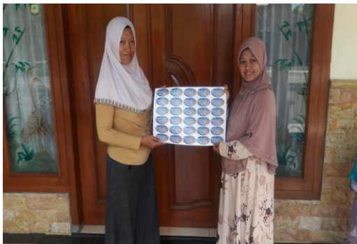
Gambar 5. Hasil Dari Pelatihan Desain Merek (Branding)

Berikutnya adalah mencetak hasil dari desain branding menjadi label yang bagus untuk dapat ditempelkan pada produk peyek mbk Anna seperti gambar 5.