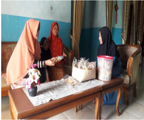
Gambar 1. Sosialisasi tahap pertama pada mitra IKM