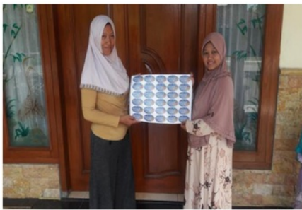
Gambar 5. Hasil Dari Pelatihan Desain Merek (Branding)

Berikutnya adalah mencetak hasil dari desain branding menjadi label yang bagus untuk dapat ditempelkan pada produk peyek mbk Anna seperti gambar 5.