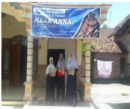
Gambar 9. Banner untuk sarana promosi rumah produksi “Peyek Mbak Anna”