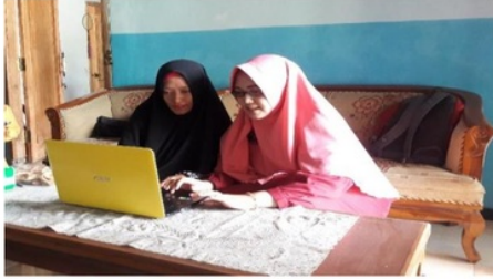
Gambar 4. Pelatihan dalam membentuk branding melalui desain merek dan label yang menarik.

Berikutnya adalah mencetak hasil dari desain branding menjadi label yang bagus untuk dapat ditempelkan pada produk peyek mbk Anna seperti gambar 5.