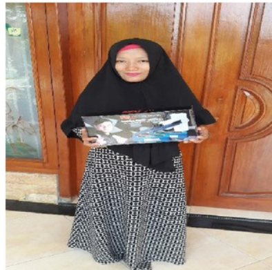
Gambar 3. Kegiatan pengabdian masyarakat dengan memberikan alat sealer untuk meningkatkan pengemasan yang rapi dan baik.