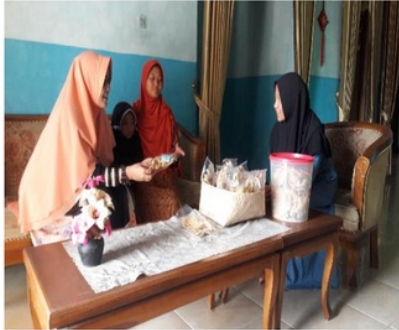
Gambar 1. Sosialisasi tahap pertama pada mitra IKM