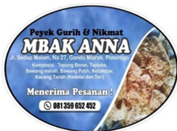
Gambar 6. Label baru Peyek Mbak Anna

Berikutnya yang dilakukan adalah memberikan pelatihan kepada mitra IKM untuk membuat promosi melalui media online yaitu membuat blog. Hal ini bertujuan salah satunya untuk menginformasikan kepada masyarakat luas tentang produk peyek mbak Anna, selain itu juga untuk memperluas pangsa pasar produk tersebut. Blog dibuat dengan tampilan yang menarik dan dapat tersambung untuk di share ke media massa lain seperti facebook, instagram dan juga whatsapp.