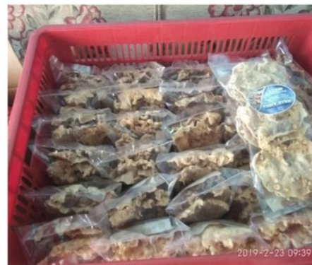
Gambar 10. Peningkatan pesanan produk mitra IKM setelah adanya pengabdian masyarakat