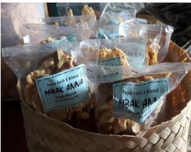
Gambar 2. Produk Mitra IKM dengan pengemasan sederhana dan menggunakan alat staples untuk menutup kemasan.

Selanjutnya adalah memberikan pelatihan kepada mitra IKM tentang cara dalam melakukan branding yaitu dengan mengubah merek yang terpasang pada label yang masih sederhana menjadi merek yang menarik. Hal ini dilakukan dengan cara membuat merek peyek mbk Anna dengan membuat desain label produk peyek yang bagus dan berdaya jual seperti gambar 4.