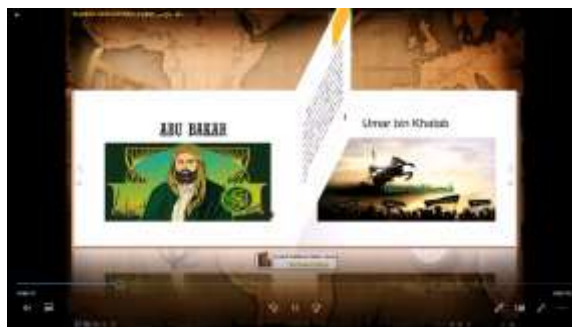
Gambar 3. Media Pembelajaran Flipbook

Tahap Design : Pada tahap ini guru melakukan langkah-langkah berikut: 1) Guru menyiapkan konten atau isi materi dengan memperhatikan bahasa yang sesuai dengan tingkat kemampuan berfikir siswa dengan tetap memperhatikan efisiensi waktu. 2) Guru memilih strategi penyampaikan dan media yang tepat untuk proses pembelajaran