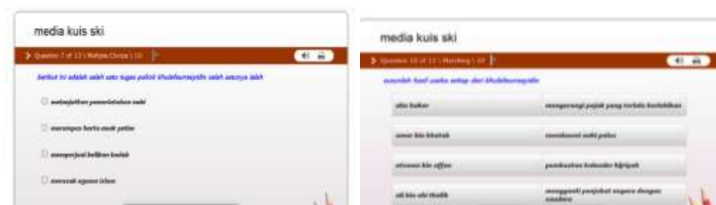
Gambar 4. Media Pembelajaran Quiz Creator

Tujuan dari tahap ini adalah menghasilkan rancangan desain. Kegiatan pada tahap ini adalah dilakukan dua langkah untuk membantu guru menyampaikan materi menggunakan medi apembelajaran flipbook dan untuk membantu penyampaian