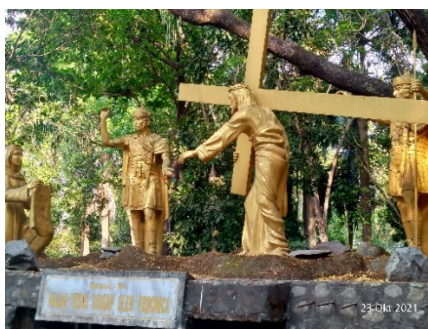
Gambar 7. Kisah Jalan Salib keenam (Veronika mengusapi wajah Yesus)

Pemberhentian kelima ditandai dengan kehadiran Simon dari Kirene yang membantu Yesus membawa salib. Simon berada di belakang Yesus dan terlihat mencoba mengangkat salib. Hal itu dilakukannya karena Simon melihat Yesus sangat kelelahan dan tempat yang ditujunya masih sangat jauh. Ditambah lagi para serdadu yang tergesa-gesa ingin segera menyelesaikan penyaliban itu (Santo Josemaria Escriva:39), “ketika mereka membawa Yesus, mereka menahan seorang yang bernama Simon dari Kirene, yang baru datang dari luar kota, lalu diletakkan salib itu di atas bahunya, supaya dipikulnya sambil mengikuti Yesus” (Lukas 23: 26) (Komisi Liturgi: 231). Sikap yang ditunjukkan Simon menjadi teladan yang baik untuk ditiru oleh seluruh umat Katolik.