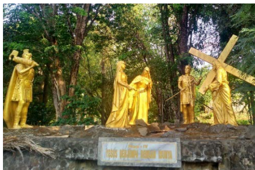
Gambar 5. Kisah Jalan Salib keempat (Yesus berjumpa dengan ibunya)

Perhentian ketiga dikisahkan bahwa Yesus jatuh untuk yang pertama kalinya. Hal itu dikarenakan Yesus membawa salib dengan beban yang cukup berat, membuat rasa sakit ditubuhnya menusuk jiwanya (Santo Josemaria Escriva: 25). Kerumunan orang-orang semakin bertambah dan memenuhi jalanan hingga menuju bukit Golgota. Sementara itu, hati Yesus penat setelah dijatuhi hukuman mati dan ditinggalkan oleh para murid-Nya, ditambah lagi Yesus ditolak oleh bangsanya. Pemberhentian ketiga ini telah berkembang dalam tradisi Katolik (Santo Josemaria Escriva:100).