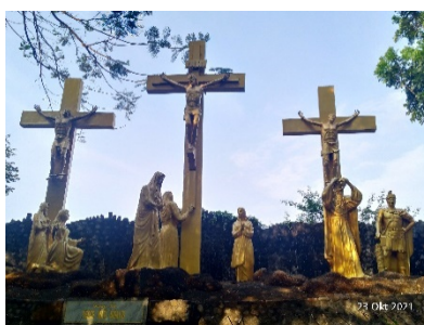
Gambar 13. Kisah Jalan Salib kedua belas (Yesus wafat di kayu salib)

Pakaian Yesus dilepas dan dilanjutkan pada pemberhentian kesebelas. Di sini terjadilah proses penyaliban Yesus di kayu salib. Yesus disalib di puncak bukit Golgota di antara dua orang penjahat (Santo Josemaria Escriva: 87). Penyaliban itu membuat umat Katolik semakin merasa berdosa, namun dalam pandangan Katolik, dengan disalibnya Yesus hal itu menjadi penebus dosa bagi umat-Nya (Prasetyo, wawancara, 2021).