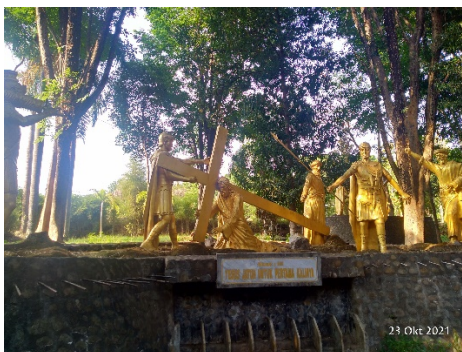
Gambar 4. Kisah Jalan Salib ketiga (Yesus jatuh untuk yang pertama kalinya)

Perhentian ketiga dikisahkan bahwa Yesus jatuh untuk yang pertama kalinya. Hal itu dikarenakan Yesus membawa salib dengan beban yang cukup berat, membuat rasa sakit ditubuhnya menusuk jiwanya (Santo Josemaria Escriva: 25). Kerumunan orang-orang semakin bertambah dan memenuhi jalanan hingga menuju bukit Golgota. Sementara itu, hati Yesus penat setelah dijatuhi hukuman mati dan ditinggalkan oleh para murid-Nya, ditambah lagi Yesus ditolak oleh bangsanya. Pemberhentian ketiga ini telah berkembang dalam tradisi Katolik (Santo Josemaria Escriva:100).