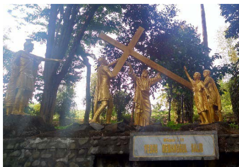
Gambar 3. Kisah Jalan Salib kedua (Yesus membawa salib)

Patung pertama dari Simbol Jalan Salib terletak tidak jauh dari Gua Maria. Gambar 2 menunjukkan pemberhentian Jalan Salib pada urutan pertama, di mana Yesus dijatuhi hukuman mati. Peristiwa tersebut menceritakan kisah Yesus saat awal mula sebelum disalib. Yesus diserahkan oleh orang-orang yang iri hati dan dua penjahat yang merupakan perampok dan pembunuh. Sementara itu, Yesus menyatakan dirinya adalah Kristus (wawancara bersama Ketua Wisma Betlehem Gereja St. Maria, 2021), padahal hakim telah menolak dan mendesak bahwa tidak ada kejahatan yang dilakukan Yesus, namun semua orang bersorak meminta Yesus untuk disalibkan dengan tuduhan-tuduhan dusta yang diajukan oleh orang-orang Yahudi. Inilah awal dari perjalanan Salib yang dikenang oleh orang-orang Katolik, khususnya bagi para peziarah yang datang ke Gereja Maria Puhsarang.