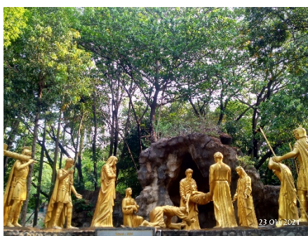
Gambar 15. Kisah Jalan Salib keempat belas (Yesus dimakamkan)

Gambar 14 terlihat kisah Yesus yang telah mati dan diturunkan dari salib, kemudian dibaringkan dalam pelukan ibu-Nya yang sedang berduka cita, “Sesungguhnya aku ini adalah hamba Tuhan; jadilah padaku menurut perkataanmu itu” (Lukas 1: 38) (Komisi Liturgi: 242). Tampak kesedihan pada wajah Maria yang membuat umat Katolik yakin akan kesetiaan Maria terhadap Yesus yang telah berkorban untuk umat-Nya.