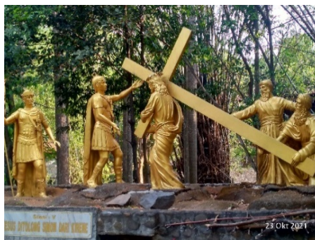
Gambar 6. Kisah Jalan Salib kelima (Simon dari Kirene membantu Yesus membawa salib)

Pemberhentian kelima ditandai dengan kehadiran Simon dari Kirene yang membantu Yesus membawa salib. Simon berada di belakang Yesus dan terlihat mencoba mengangkat salib. Hal itu dilakukannya karena Simon melihat Yesus sangat kelelahan dan tempat yang ditujunya masih sangat jauh. Ditambah lagi para serdadu yang tergesa-gesa ingin segera menyelesaikan penyaliban itu (Santo Josemaria Escriva:39), “ketika mereka membawa Yesus, mereka menahan seorang yang bernama Simon dari Kirene, yang baru datang dari luar kota, lalu diletakkan salib itu di atas bahunya, supaya dipikulnya sambil mengikuti Yesus” (Lukas 23: 26) (Komisi Liturgi: 231). Sikap yang ditunjukkan Simon menjadi teladan yang baik untuk ditiru oleh seluruh umat Katolik.