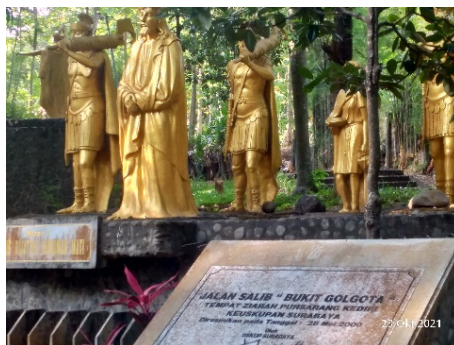
Gambar 2. Kisah Jalan Salib pertama (Yesus dijatuhi hukuman mati)

Patung pertama dari Simbol Jalan Salib terletak tidak jauh dari Gua Maria. Gambar 2 menunjukkan pemberhentian Jalan Salib pada urutan pertama, di mana Yesus dijatuhi hukuman mati. Peristiwa tersebut menceritakan kisah Yesus saat awal mula sebelum disalib. Yesus diserahkan oleh orang-orang yang iri hati dan dua penjahat yang merupakan perampok dan pembunuh. Sementara itu, Yesus menyatakan dirinya adalah Kristus (wawancara bersama Ketua Wisma Betlehem Gereja St. Maria, 2021), padahal hakim telah menolak dan mendesak bahwa tidak ada kejahatan yang dilakukan Yesus, namun semua orang bersorak meminta Yesus untuk disalibkan dengan tuduhan-tuduhan dusta yang diajukan oleh orang-orang Yahudi. Inilah awal dari perjalanan Salib yang dikenang oleh orang-orang Katolik, khususnya bagi para peziarah yang datang ke Gereja Maria Puhsarang.