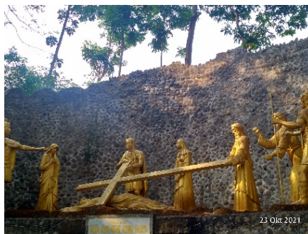
Gambar 10. Kisah Jalan Salib kesembilan (Yesus jatuh ketiga kalinya di bawah salib)

menjadi pribadi yang peduli terhadap sesama (wawancara bersama Ketua Wisma Betlehem Gereja St. Maria, 2021).