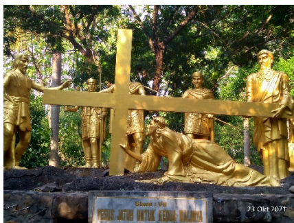
Gambar 8. Kisah Jalan Salib ketujuh (Yesus terjatuh untuk kedua kalinya)

dihindari orang, seorang yang penuh kesengsaraan dan yang biasa menderita kesakitan; ia sangat dihina, sehingga orang menutup mukanya terhadap dia....” (Yesaya 52: 14; 53: 2-3) (Komisi Liturgi: 232).