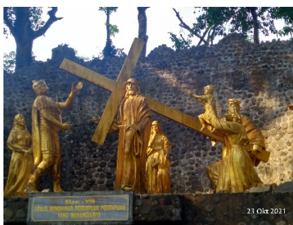
Gambar 9. Kisah Jalan Salib kedelapan (Yesus menasihati wanita Yerusalem yang menangis)

Pada pemberhentian ketujuh Yesus terjatuh untuk kedua kalinya walaupun sudah dibantu oleh Simon dan Veronika. Tubuhnya tetap letih, meskipun demikian tanpa mengeluh Yesus bangun kembali untuk meneruskan perjalanannya yang masih jauh (Santo Josemaria Escriva: 234). Dalam keadaan seperti itu, Yesus masih berusaha melanjutkan perjalanannya, sehingga dari pemberhentian ini umat Katolik meneladani sikap Yesus agar tidak mudah menyerah (wawancara bersama Ketua Wisma Betlehem Gereja St. Maria, 2021).