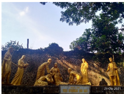
Gambar 14. Kisah Jalan Salib ketiga belas (Yesus diturunkan dari salib)

Gambar 14 terlihat kisah Yesus yang telah mati dan diturunkan dari salib, kemudian dibaringkan dalam pelukan ibu-Nya yang sedang berduka cita, “Sesungguhnya aku ini adalah hamba Tuhan; jadilah padaku menurut perkataanmu itu” (Lukas 1: 38) (Komisi Liturgi: 242). Tampak kesedihan pada wajah Maria yang membuat umat Katolik yakin akan kesetiaan Maria terhadap Yesus yang telah berkorban untuk umat-Nya.