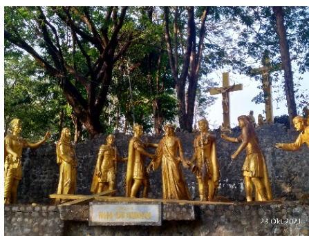
Gambar 11. Kisah Jalan Salib kesepuluh (pakaian Yesus dilepaskan)

Pemberhentian kesembilan memperlihatkan Yesus jatuh untuk ketiga kalinya pada puncak Golgota yang menanjak (Santo Josemaria Escriva: 71). Yesus menguatkan diri agar segera sampai di puncak Golgota, namun Yesus tidak sanggup bertahan karena tenaganya sudah habis. Kemudian Yesus terpelanting ke tanah yang berbatu hingga darah keluar dari tubuhnya (wawancara bersama Ketua Wisma Betlehem Gereja St. Maria, 2021). Pemberhentian kesembilan ini mengajarkan umat Katolik agar senantiasa kuat dalam menghadapi cobaan hidup sepahit apapun cobaan itu.