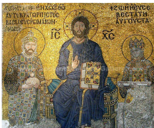
Gambar 1. Ikon Yesus dalam seni Byzantium

Salah satu bentuk karya seni Kristiani itu bisa berupa lambang-lambang kuno yang menceritakan ide-ide keagamaan Kristen. Simbol-simbol itu adalah sesuatu yang memiliki makna sesuai dengan apa yang dipresentasikan oleh penggagasnya sehingga menjadi ikon (Wulandari dan Siregar:3). Ikon dapat dimaksud sebagai lukisan maupun gambaran yang terdapat di panel kayu Gereja Kristen Ortodoks pada masa kebaktian. Segala macam bentuk kesenian Kristiani mulai dikembangkan oleh kekaisaran Romawi Timur dengan membuat ukiran-ukiran dan lukisan di dinding Gereja. Kesenian itu disebut juga sebagai kesenian Byzantin, bertujuan untuk mengungkapkan kemuliaan ilahi. Beberapa ikon itu masih ada hingga saat ini. Salah satu yang paling besar terdapat di Gereja Hagia Sophia di Istanbul, Turki.