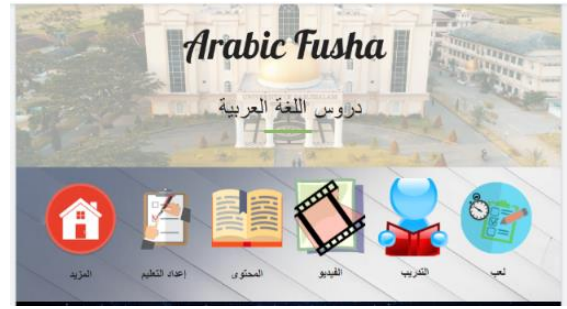
الصورة ٢: الصفحة الأمامية