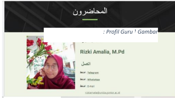
الصورة ١: الصفحة للمدرسين