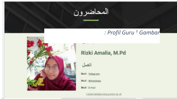
الصورة ١: الصفحة للمدرسين