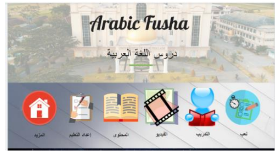
الصورة ٢: الصفحة الأمامية