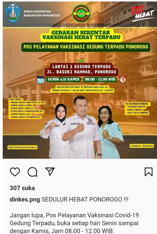
Gambar 3. Jadwal vaksinasi pada akun resmi Dinas Kesehatan Ponorogo (instagram.com/dinkes.png)

Pada tahapan R selanjutnya yaitu Radar , Dinkes Ponorogo membuat respons management SOP dan krisis yang dilakukan dengan menentukan skala prioritas. Hal pertama kali yang dilakukan adalah mengidentifikasi dan menganalisis tingginya kenaikan kasus pada Covid varian Omicron di Ponorogo, apa saja penyebab dari kenaikan kasus, berapa banyaknya pasien yang terpapar virus Covid varian Omicron, pendataan kesiapan alat kesehatan dari Dinkes Ponorogo, dan kesiapan tenaga medis untuk menangani kasus baru ini, semua komponen ini yang kemudian dikumpulkan dan dipadukan sehingga menjadi informasi yang penting dalam menentukan skala prioritas.