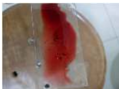
Gambar 5. Larutan Safranin