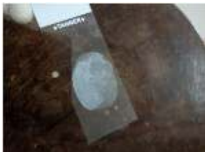
Gambar 4. Cairan Mordant setelah dibilas dengan air