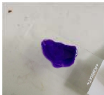
Gambar 1. Larutan Kristal Violet

Preparat dilihat di bawah mikroskop dengan perbesaran 10x atau 100x. Hasil pewarnaan difoto dengan jelas. Sel bakteri berwarna biru menunjukkan bakteri termasuk kelompok Gram positif dan bakteri gram negatif akan menunjukkan warna merah. Mikroskop hanya membantu melihat perbedaan bakteri gram negatif dan bakteri gram positif.