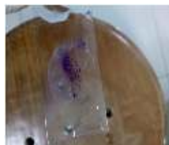
Gambar 2. Larutan Kristal Violet setelah dibilas dengan air