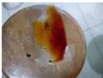
Gambar 3. Cairan Mordant