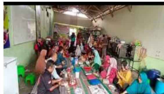
Gambar 1. Sosialisasi tahap pertama

Permasalahan mitra anggota asosiasi UMKM Ponorogo adalah dalam hal pengembangan usaha. Hal ini disebabkan karena para UMKM merasa bingung bagaimana cara pengembangan usahanya dan dapat dimulai dari sesi yang mana, sehingga tahap pertama adalah kami melakukan sosialisasi pada anggota asosiasi UMKM Ponorogo untuk dapat melakukan perubahan usaha menjadi lebih maju lagi dengan mempelajari dan mengetahui sisi yang dapat dikembangkan dari usaha yang dijalanannya.