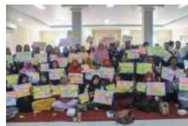
Gambar 11. Hasil Pelatihan Analisis SWOT dan BMC 2