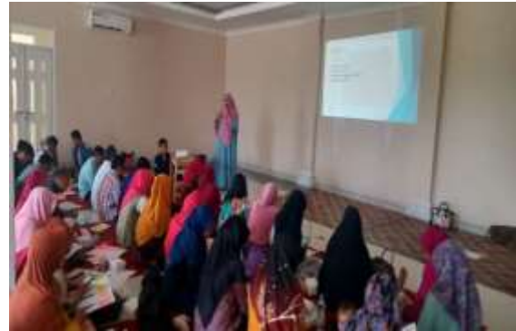
Gambar 6. Kegiatan Pelatihan 3