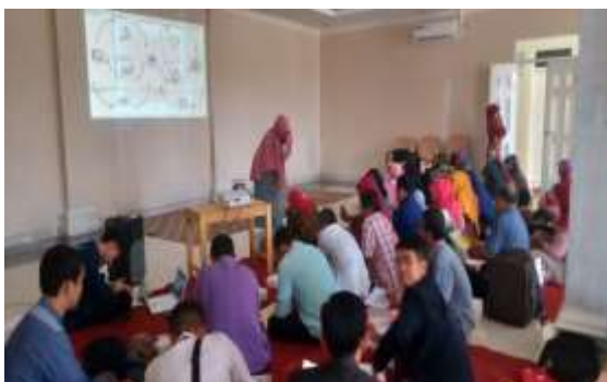
Gambar 5. Kegiatan Pelatihan 2