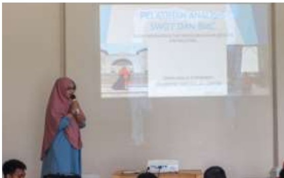
Gambar 4. Kegiatan Pelatihan 1

Melihat permasalahan tersebut, kami membantu dengan memberikan wawasan terlebih dahulu tentang pentingnya pengembangan usaha mikro dalam menghadapi tantangan global. Pengembangan usaha dapat dimulai dengan mengetahui kemampuan suatu usaha serta peluang yang dapat dimanfaatkan.