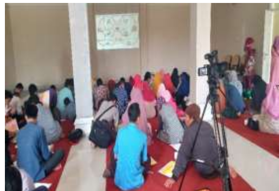
Gambar 7. Kegiatan pelatihan 4

Adapun pelatihan yang diberikan adalah melakukan analisis usaha masing-masing para UMKM dengan menuliskan kekuatan dari usaha yang dikelola para UMKM Ponorogo. Setelah itu adalah menuliskan kelemahan usaha masing-masing, dan dilanjutkan menuliskan peluang kedepan yang dapat dimasuki walaupun saat ini masih belum mampu untuk melakukannya karena berbagai faktor kelemahan yang dimiliki. Terakhir adalah menuliskan ancaman-ancaman yang dihadapi dari usaha yang saat ini dijalankannya.