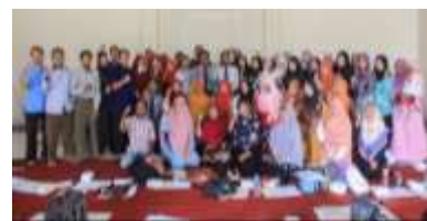
Gambar 10. Hasil Pelatihan Analisis SWOT dan BMC 1