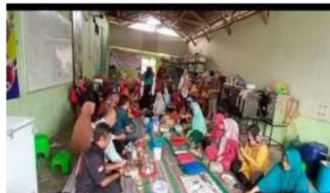
Gambar 1. Sosialisasi tahap pertama

Permasalahan mitra anggota asosiasi UMKM Ponorogo adalah dalam hal pengembangan usaha. Hal ini disebabkan karena para UMKM merasa bingung bagaimana cara pengembangan usahanya dan dapat dimulai dari sesi yang mana, sehingga tahap pertama adalah kami melakukan sosialisasi pada anggota asosiasi UMKM Ponorogo untuk dapat melakukan perubahan usaha menjadi lebih maju lagi dengan mempelajari dan mengetahui sisi yang dapat dikembangkan dari usaha yang dijalanannya.