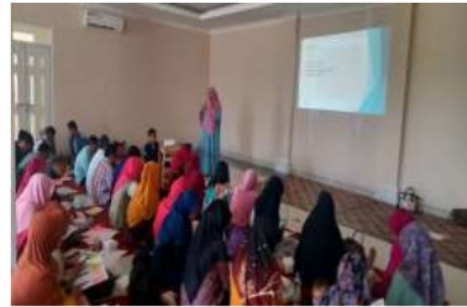
Gambar 6. Kegiatan Pelatihan 3