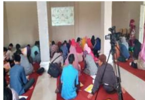
Gambar 7. Kegiatan pelatihan 4

Adapun pelatihan yang diberikan adalah melakukan analisis usaha masing-masing para UMKM dengan menuliskan kekuatan dari usaha yang dikelola para UMKM Ponorogo. Setelah itu adalah menuliskan kelemahan usaha masing-masing, dan dilanjutkan menuliskan peluang kedepan yang dapat dimasuki walaupun saat ini masih belum mampu untuk melakukannya karena berbagai faktor kelemahan yang dimiliki. Terakhir adalah menuliskan ancaman-ancaman yang dihadapi dari usaha yang saat ini dijalankannya.