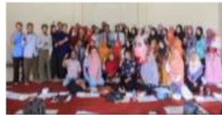
Gambar 10. Hasil Pelatihan Analisis SWOT dan BMC 1