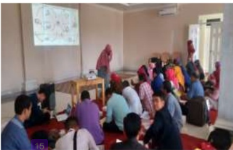
Gambar 5. Kegiatan Pelatihan 2