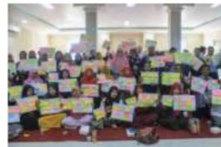
Gambar 11. Hasil Pelatihan Analisis SWOT dan BMC 2