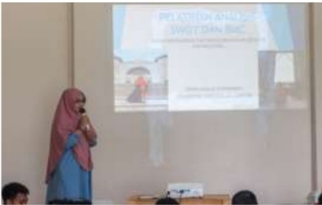
Gambar 4. Kegiatan Pelatihan 1

Melihat permasalahan tersebut, kami membantu dengan memberikan wawasan terlebih dahulu tentang pentingnya pengembangan usaha mikro dalam menghadapi tantangan global. Pengembangan usaha dapat dimulai dengan mengetahui kemampuan suatu usaha serta peluang yang dapat dimanfaatkan.