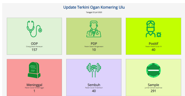
Gambar 3. Data Kasus Covid-19 di Kabupaten Ogan Komering Ulu

Sumatera Selatan merupakan salah satu provinsi di Indonesia yang terdampak Covid-19. Salah satu Kabupaten di Sumatera Selatan yang menjadi penyumbang kasus positif-19 yang cukup tinggi adalah Kabupaten Ogan Komering Ulu. Jumlah pasien yang berstatus Positif Covid-19 di Kabupaten Ogan Komering Ulu mencapai 40 orang pada tanggal 20 Agustus 2020, angka ini merupakan jumlah yang cukup tinggi di bandingkan dengan Kabupaten/Kota yang berada di wilayah Provinsi Sumatera Selatan, hal ini seperti terlihat pada gambar data berikut :