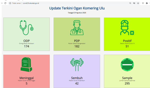
Gambar 5. Data Covid-19 Kabupaten OKU.

57