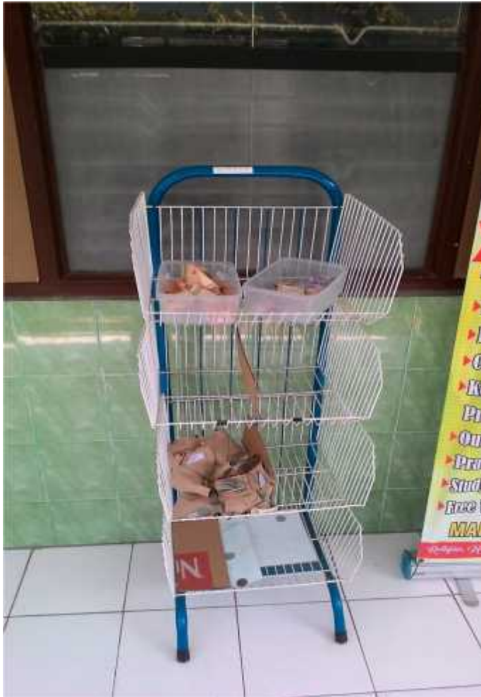
Gambar 1. Kantin Kejujuran